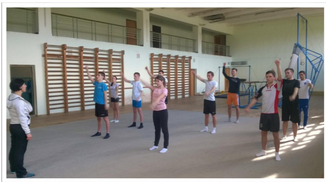
Рис. 1.3. Під наглядом керівника від бази проводяться заняття з фітнесу студентами, організовується робота в групах СВ та в СМГ.

Приймається участь у складанні річних планів-графіків проходження програмного матеріалу, поурочних робочих планів на період навчання. Проводиться підготовка планів-конспектів занять з фізичного виховання, факультативних занять, підбираються методичні і дидактичні матеріали, а також необхідний спортивний інвентар.