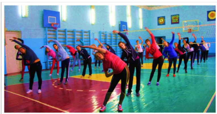
Рис. 1.1. Педагогічна у ЗВО проводиться в закладах вищої освіти.

Навчальна педагогічна у ЗВО проводиться в навчальних закладах вищої освіти (рис. 1.1.). Її спрямування - підготовка до роботи викладачем закладу вищої освіти на кафедрах фізкультурно-спортивного спрямування. Її змістом є формування здатностей виконувати посадові обов'язки викладача закладу вищої освіти; ознайомлення з структурою і організацією роботи кафедр фізкультурного та спортивного спрямування; формування умінь та навичок планування процесу фізичного виховання студентів, методики проведення учбових занять та занять спортивного вдосконалення.