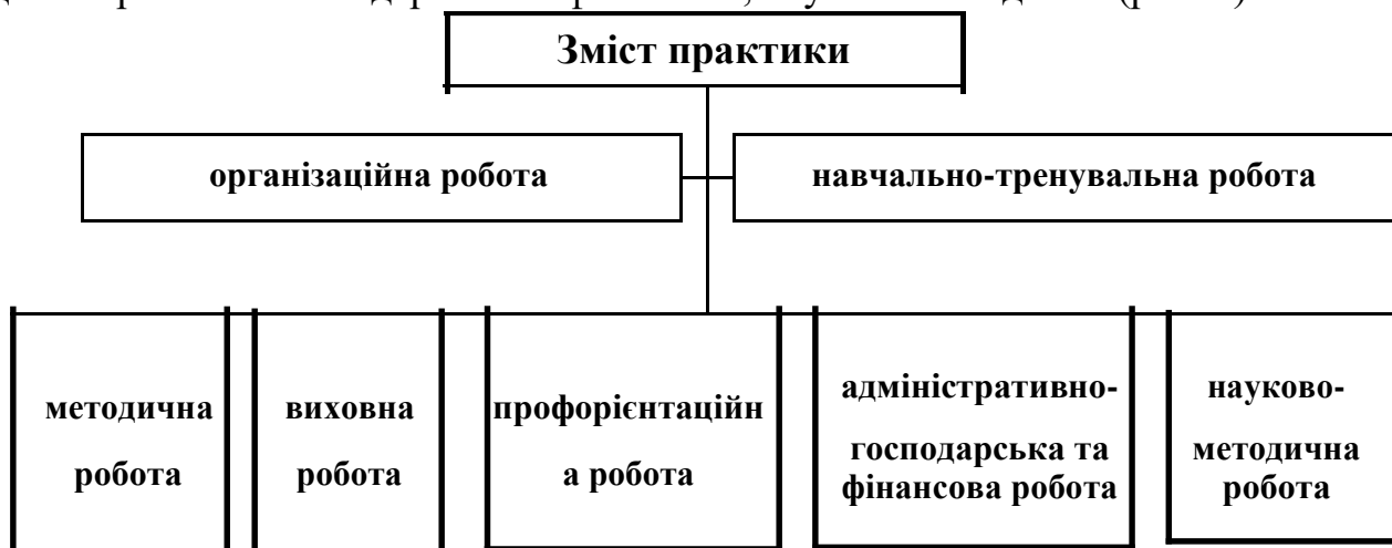
Рис. 2. Види робіт, що складають зміст педагогічної практики у ЗВО.

Змістом тренерської переддипломної практики за спеціальністю є такі види роботи: організаційна; навчально-тренувальна; виховна; профорієнтаційна; адміністративно-господарська та фінансова; науково-методична (рис. 2).