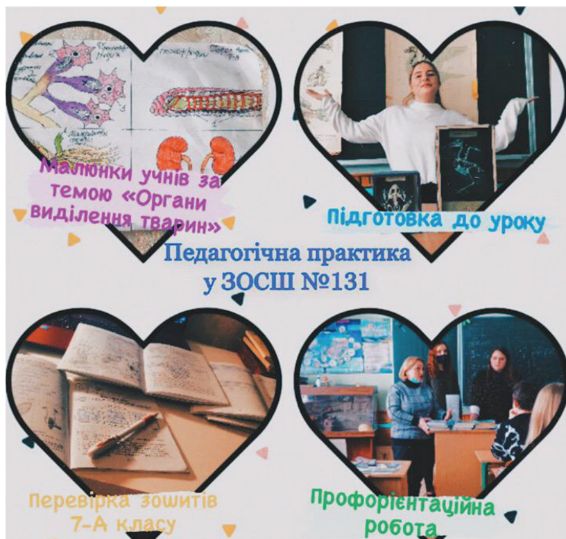
Методичне портфоліо здобувача вищої освіти

нір», «Педагогічні роздуми», «Віртуальна подорож у педагогічне минуле» тощо.