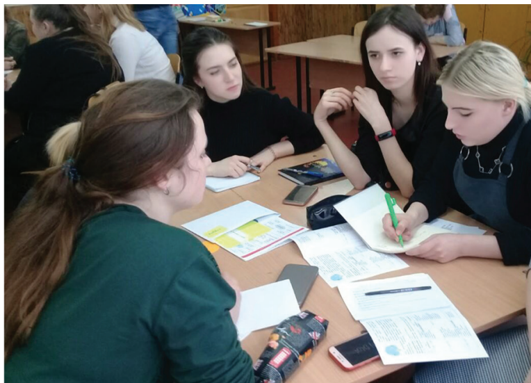
Виконання методичних практико орієнтованих завдань

свою думку; «аркуш мети фахівця», «мозковий штурм», «ГРОНО», метод «ПРЕС», «сенкан», «кубування», «акваріум», «обери позицію», «читання (педагогічних ситуацій) із зупинками», «читання з позначками»; «обмін думками», «знаю, хочу дізнатися, дізнався», «тонкі і товсті питання» («однозначні» (фактичні) та розгорнуті, ґрунтовні відповіді); методичні дебати та турніри; групове (парне) моделювання та презентація знань різних типів тощо.