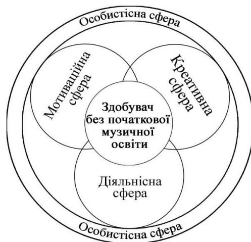
Рис. 1 Сфери персонального освітнього середовища професійної підготовки майбутніх учителів музичного мистецтва без початкової музичної освіти

проводилось на основі діаграми Ейлера-Венна (рис. 1). Такий підхід мав місце в працях О. Єжової, Ю. Єчкало, Л. Карпової [2; 4; 10]. У нашому підході цей простір представлено як сукупність чотирьох сфер, кожна з яких є відповідною підструктурою, що сприяє формуванню конкретного компоненту персонального освітнього середовища, а саме: діяльнісної, мотиваційної, креативної та особистісної сфери [6; 9].