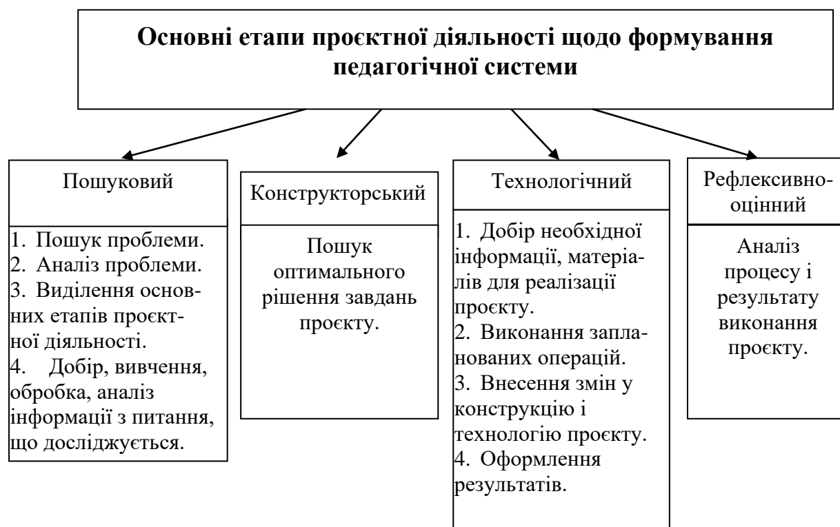
Рис 1. Етапи проектної діяльності.

Спираючись на результати досліджень та власний досвід педагогічної діяльності у якості критеріїв оцінювання ефективності педагогічної системи у педагогічному ЗВО розглядаємо такі: