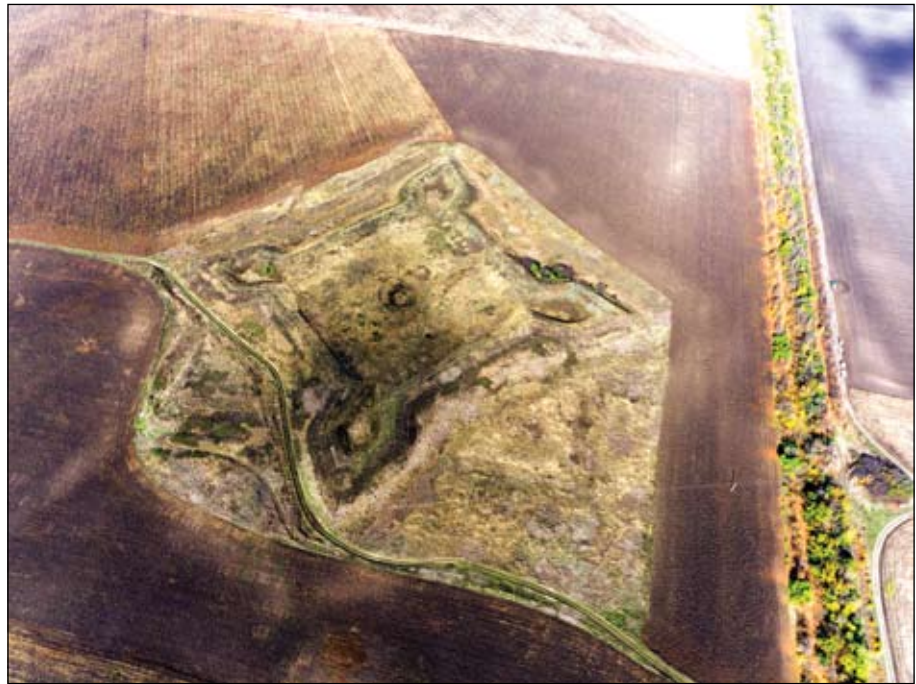
Рис. 2. Фортеця Тамбовська, вигляд з півдня

але була віддалена безпосередньо від периметру укріплень, розташованих на відкритій місцевості.