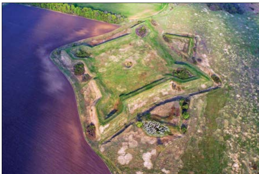
Рис. 6. Фортеця Святого Іоанна, вигляд з заходу

Між фортом і заплавою річки збереглася ділянка лінії укріплень з влаштованими на ній реданами.