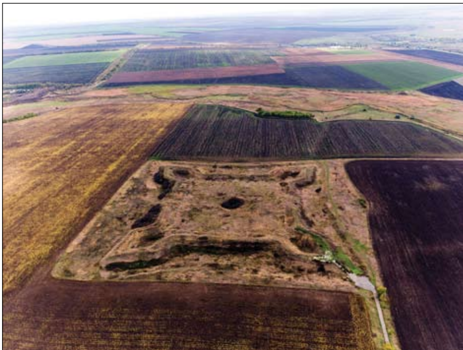
Рис. 3. Фортеця Слобідська, вигляд з північного заходу

Фортеця Святого Олексія (до перейменування в 1738 р. Берецька ) розташована між м. Первомайськ і с. Олексіївка Первомайського р-ну Харківської обл. У топографічному відношенні фортифікації влаштовані на плато правого берега р. Берека.