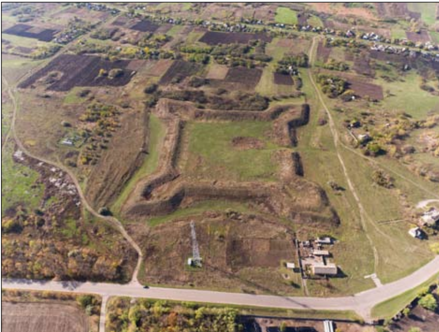
Рис. 1. Фортеця Святого Петра, вигляд зі сходу

Українська лінія збудована для захисту від кримських татар і втратила військово-оборонне значення після спорудження в 1770 р. Дніпровської лінії. Як і всі оборонні лінії, що були зведені раніше і пізніше на різних ділянках порубіжжя, Українська лінія являла собою єдиний фортифікаційний комплекс, що потребував утримання в належному стані споруд, логістичного забезпечення необхідних життєвих потреб підрозділів тощо. Також означена лінія укріплень сприяла господарському освоєнню територій, які тепер були прикриті від небезпеки несподіваних татарських нападів. Безпосередньо оборона організовувалась з урахуванням тактики та стратегії супротивника та враховувала особливості місцевості і, насамперед, шляхів проникнення на територію, що бралася під захист. Тому, зокрема фортеці, влаштувалися в місцях високого ймовірного проникнення супротивника. Також безпосередньо в місцях перелазів — потенційно небезпечних точках вірогідного проникнення татар — споруджувались редути.