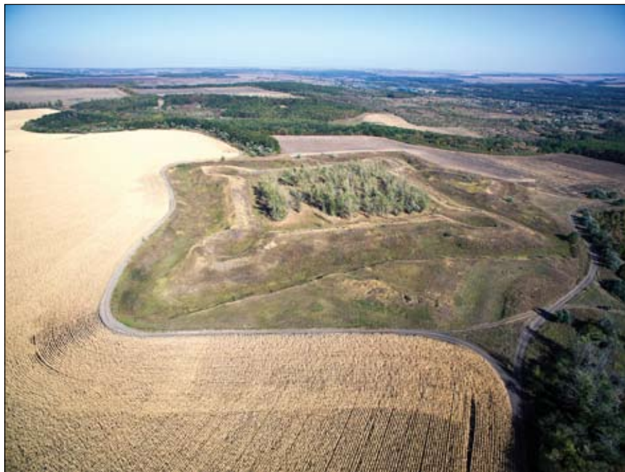
Рис. 5. Фортеця Святої Параскеви, вигляд з південного сходу

розташована на східній околиці с. Єфремівка Первомайського р-ну Харківської обл. У топографічному відношенні фортифікації влаштовані на плато правого берега р. Оріль, поблизу її витоків.