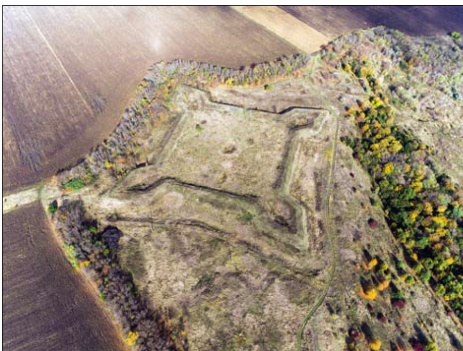
Рис. 4. Фортеця Святого Михайла, вигляд з півдня

Фортеця Єфремівська (до перейменування в 1738 р. Троїцька, при Троїчатих буераках )