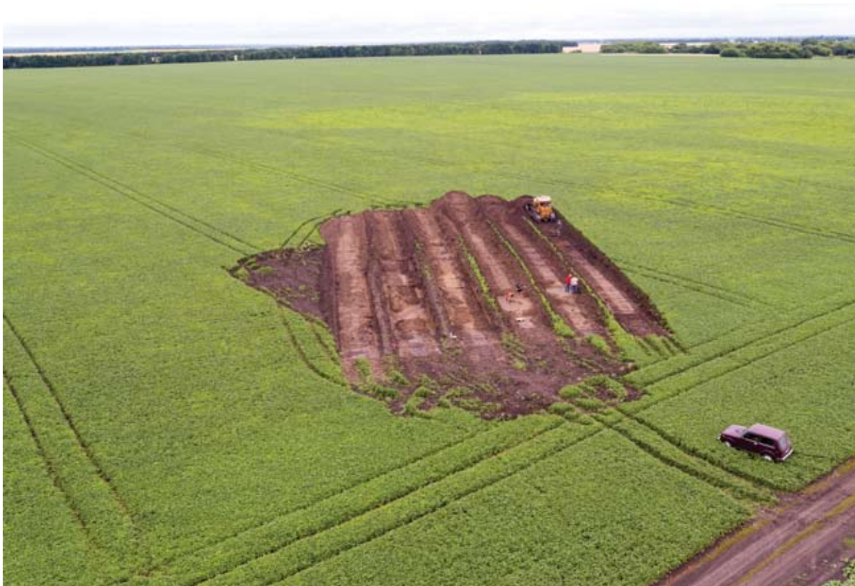
Рис. 2. Загальний вид розкопок кургану 1 біля с. Настеньківка Краснокутського р-ну, вид зі сходу (зйомка дроном DJI Inspire 1)

Закладений розкоп з траншеями, зорієнтованими за лінією захід — схід, мав загальну площу 826 м 2 (рис. 2). У ході проведення розкопок була виявлена видовжена з південного заходу на північний схід канава завширшки близько 2 м, яка звужувалась до низу, де мала ширину переважно близько 1 м. Гумусове заповнення, що фіксувалося від рівня розораного шару, не містило культурних решток.