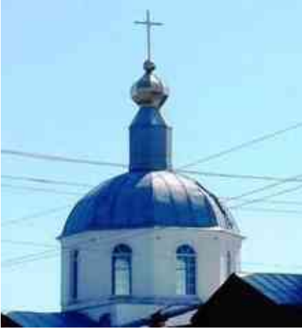
7. Купол храму. Фото 2016.