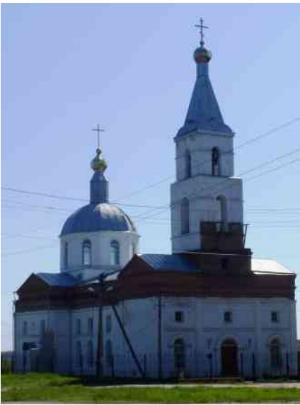
7. Вигляд із західного боку. Фото 2016.