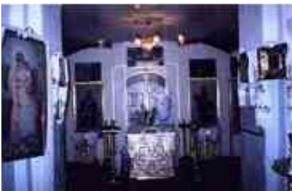
7. Фрагмент інтер'єру.