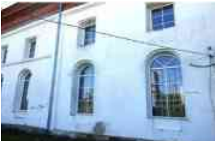
7. Фрагмент бічного (північного) фасаду. Фото 2016.