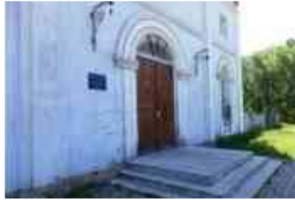
7. Фрагмент головного фасаду. Парадний вхід. Фото 2016.