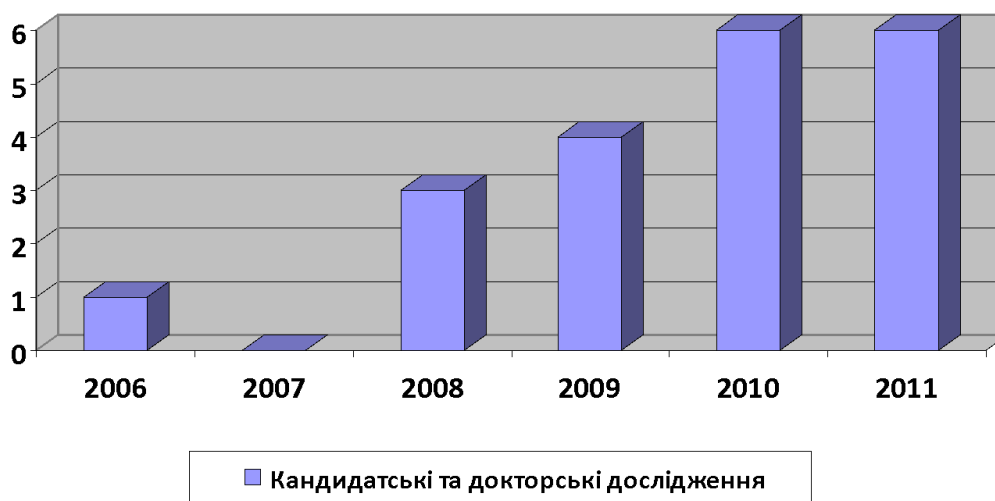
Рис. 3. Кількісний розподіл наукових праць, присвячених проблемам інклюзивної освіти з 2006 по 2011 рр. (за роками затвердження тем)

Так, у досліджуваній період було закладено важливий законодавчий та науково-методичний фундамент для розгортання освітньої інклюзії, що забезпечило зміцнення інклюзивних тенденцій в освіті. За даними Міністерства науки і освіти України, протягом 2011-2017 років мережа інтернатних закладів для дітей з порушеннями здоров'я зменшилася на 86%. Натомість на 22,4% збільшилася мережа навчально-реабілітаційних центрів – закладів системи освіти, орієнтованих на надання послуг дітям зі складними порушеннями розвитку. Відповідно зросла кількість дітей, які отримали ці послуги: у 2015-2016 н. р. у 58-ми закладах навчалось 6,4 тисяч учениць і учнів, у 2016-2017 н. р. – у 71-му навчально-реабілітаційному центрі отримали послуги 7,9 тисяч дітей.