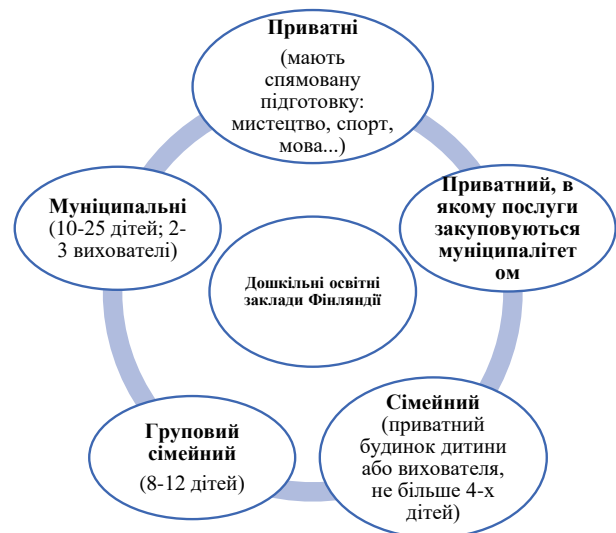
Рис. 1. Типи дошкільних освітніх закладів Фінляндії (інтерпретація автора)

Взаємодія з батьками ґрунтується на тому, що батьки самі обирають заклад дошкільної освіти, який відвідує їх дитина, але здійснюючи даний вибір батьки розуміють, що їх вибір матиме певну ціну. Залучаючи батьків до визначення пріоритетів освітніх програм, які будуть реалізовуватись в конкретному закладі дошкільної освіти, педагогічний колектив бере на себе зобов'язання у реалізації визначеної програми. Зворотний зв'язок з батьками встановлюється через активне спілкування під час аналізу результатів діяльності дитини. Важливим моментом є те, що батькам повідомляються лише досягнення дитини, в той час як будь-які проблеми пов'язані із дитячим розвитком розв'язуються вихователями місцево та в індивідуальному порядку, що зумовлено