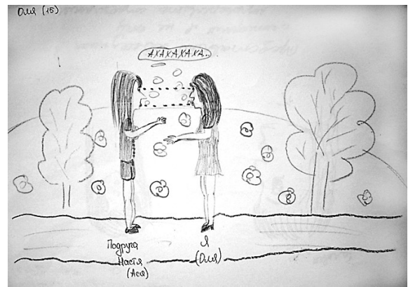
Рис. 5. Приклад малюнку досліджуваного

Процес спілкування, що зображений підлітками, які живуть в родині, достатньо емоційний, невимушений, більш яскравий. Підлітки не бояться проявляти себе у спілкуванні, пізнавати щось цікаве та дізнаватись щось нове про партнера по спілкуванню (див. рис. 5). Проте також необхідно сказати, що така місьцями надмірна емоційність може спричинювати відчуття підлітком певної некомпетентності у процесі спілкування, що також проявляється на малюнках досліджуваних.