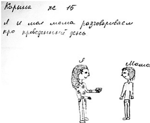
Рис. 4. Приклад малюнку досліджуваного

На всіх малюнках зображені люди, процес спілкування між людьми, є головний герой, який ідентифікований з самим автором малюнка. Це свідчить про те, що у процесі спілкування підліток можуть бути самими собою, проявляти свої почуття, бути повноцінними суб'єктами процесу спілкування. Також необхідно відмітити, що партнери по спілкуванню теж ідентифіковані, у них є ім'я чи пояснення, хто вони є. Це показник того, що навколишніх людей підлітки сприймають як партнерів по спілкуванню, особливо тих, з ким знайомі, певним чином взаємодіють. Процес спілкування з цими людьми не блокований.