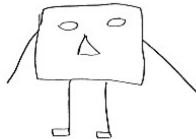
Рис. 2. Приклад малюнку досліджуваного

Ще однією ознакою, яка часто проходить крізь малюнки підлітків, які живуть в інтернаті, є ознака відчуття страху та стурбованості щодо думки оточуючих. Це може бути спричинене попереднім негативним досвідом спілкування чи близьких взаємовідносин. Також це може бути пов'язано з високим рівнем страху неприйняття та відторгнення, що спостерігається у досліджуваних цієї групи. Необхідно сказати, що це пояснює те, що по малюнкам спостерігається проблемність спілкування, його вищезазначені особливості (рис. 3).