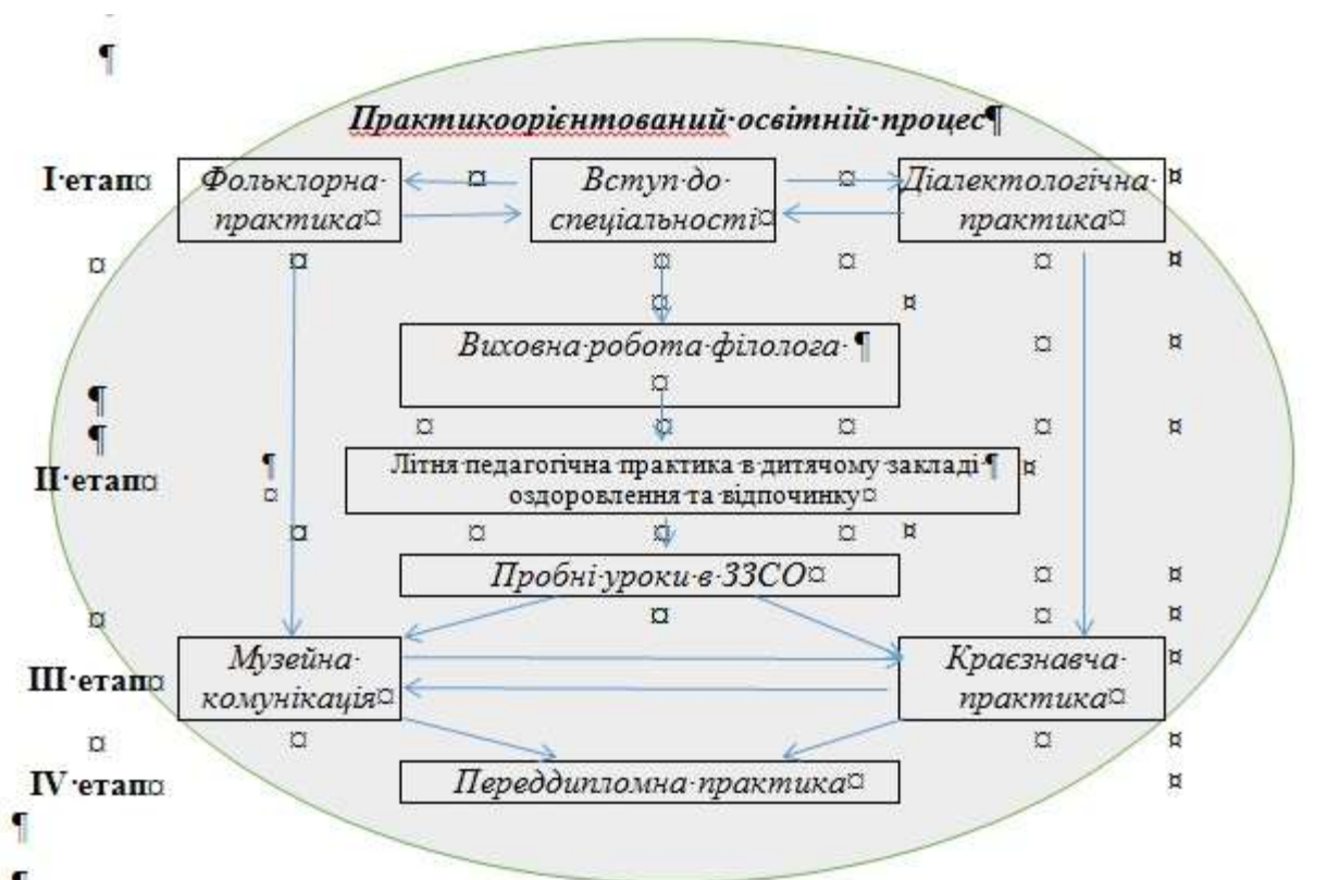
Рис. 2. Модель практикоорієнтованого навчання освітньої програми Українська мова та література

Ця система практикоорієнтованого навчання залишається актуальною, і тільки її збереження й удосконалення гарантує швидку та якісну професійну адаптацію молодих спеціалістів на виробництві, що задовольняє потреби сучасних споживачів філологічних послуг.