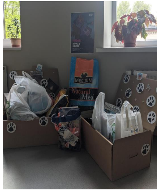
Рис. 2. Представлення результату проєкту «Врятуй тваринку» (ліворуч: створення наклейок та платкатів для проведення благодійної акції для притулку тварин; праворуч – благодійні внески).

Кожен бажаючий міг зробити у благодійний внесок та обрати собі одну наклейку із запропонованих. Найкращі роботи учнів були відзначені призами.