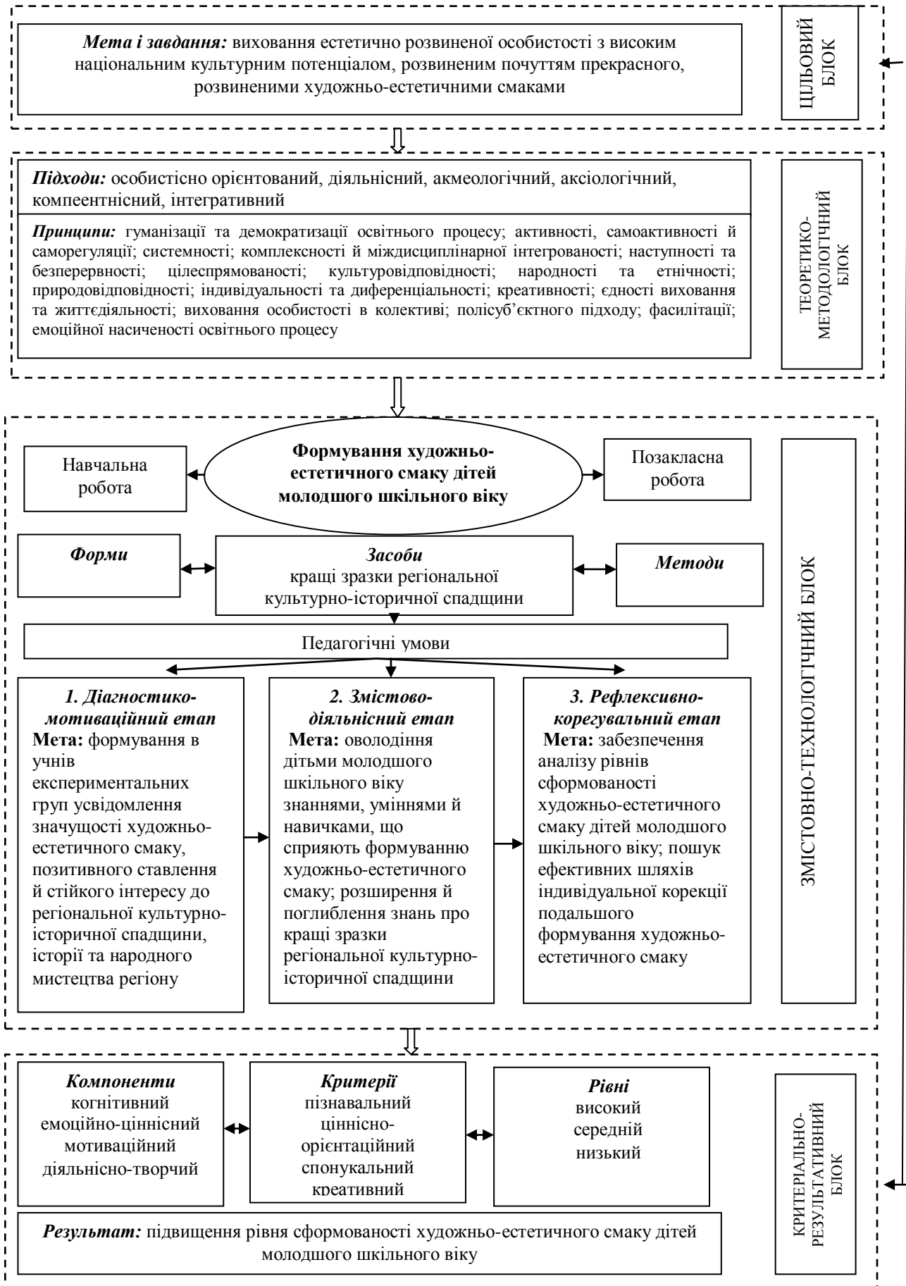
Рис. 1. Модель організаційно-педагогічної системи формування художньо-естетичного смаку дітей молодшого шкільного віку засобами регіональної культурно-історичної спадщини