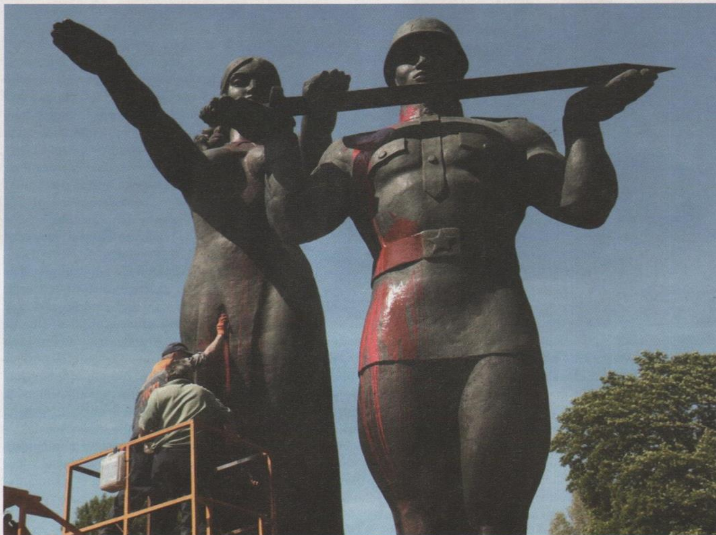
Monument válečné slávy sovětské armády ve Lvově, odhalen v květnu 1970. Během posledních několika let se stal terčem řady incidentů – na pomníku se objevovaly skvrny od rudé barvy a nápisy „Pomník okupantům“.

Kotljarevského se v roce 1903 v Poltavě sjel výkvět tehdejší ukrajinské inteligence. Byl to první pomník propagující v městském kulturním prostoru ukrajinskou kulturu. Realizaci vítězného návrhu pomníku předního ukrajinského básníka Tarase Ševčenko v Kyjevě podle výsledků soutěže, vyhlášené roku 1911, však v roce 1914 překazil zákaz úřadů.