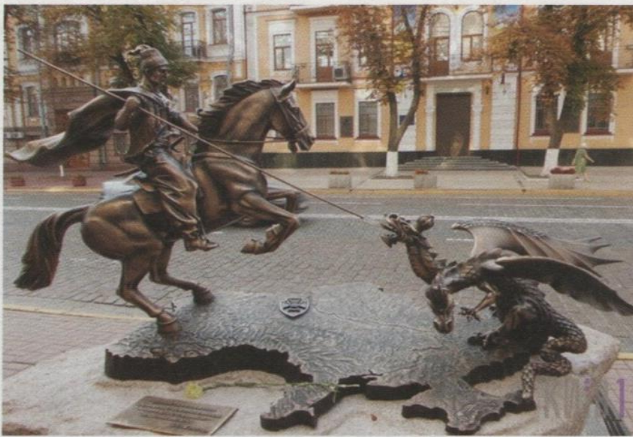
„Kozák přemožitel“ – pomník věnovaný vojinům ATO (právní definice rusko-ukrajinské války), odhalený v centru Kyjeva na den nezávislosti Ukrajiny 24. srpna 2015.

ideologii nového režimu; šlo jednak o provizória, často postavená na starých podstavcích, a jednak o mohutné kolosy dominující svému okolí, jako například pomníky sovětského revolucionáře Artoma (Fjodora Sergejeva) v donbaských městech Artomovsk (nyní Bachmut) a Slavjanogorsk (nyní Svjatohirsk). I později bývali na pomnících ze sovětského období často zvěčňováni sovětsští straničtí a státní činitelé a vojevůdci. Navíc se stalo běžnou praxí, že dvoj- a vícenásobným hrdinům Sovětského svazu či hrdinům socialistické práce odhalovali v jejich rodišti bysty ještě za jejich života. V Kyjevě se například roku 1982 objevila bysta předsedy Akademie věd Ukrajiny, dnes 99letého Boryse Patona.