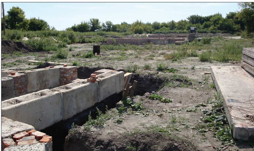
Рис. 8. Бетонные фундаменты в котлованах новостроек на территории Верхнесалтовского селища к северу от городища (2009 г., вид с севера)