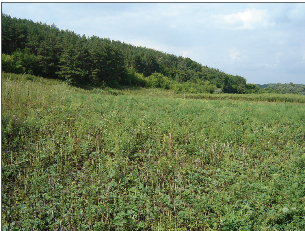
Рис. 6. Территория Верхнесалтовского селища у катакомбного могильника (на заднем плане на возвышенности, поросшей сосновыми деревьями; 2006 г., вид с юго-востока)