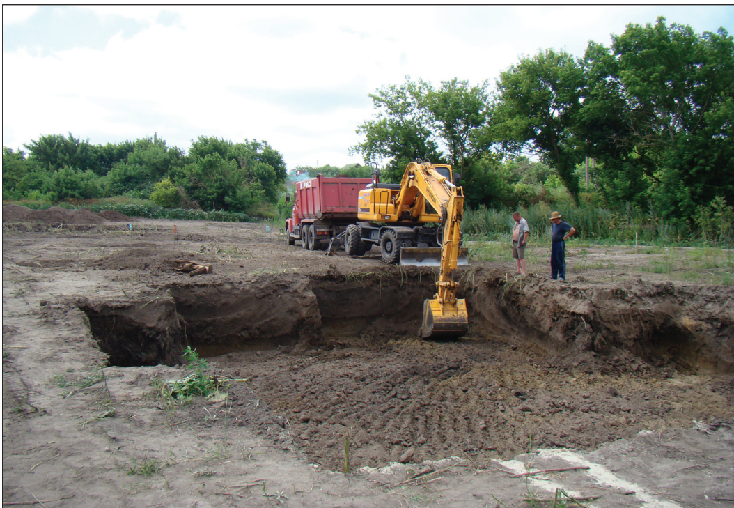
Рис. 9. Процесс разрушения и вывоза культурного слоя на Верхнесалтовском селище к северу от городища (2009 г., вид с северо-востока)