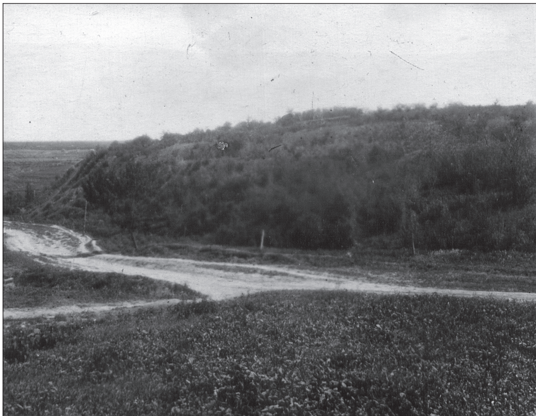
Рис. 4. Верхнесалтовское городище в середине XX в. (вид с юго-запада) Рис. 4. Верхньосалтівське городище всередине XX ст. (вид з південного заходу) Fig. 4. Verhnij Saltiv settlement in the middle XX century. (view from the southwest)