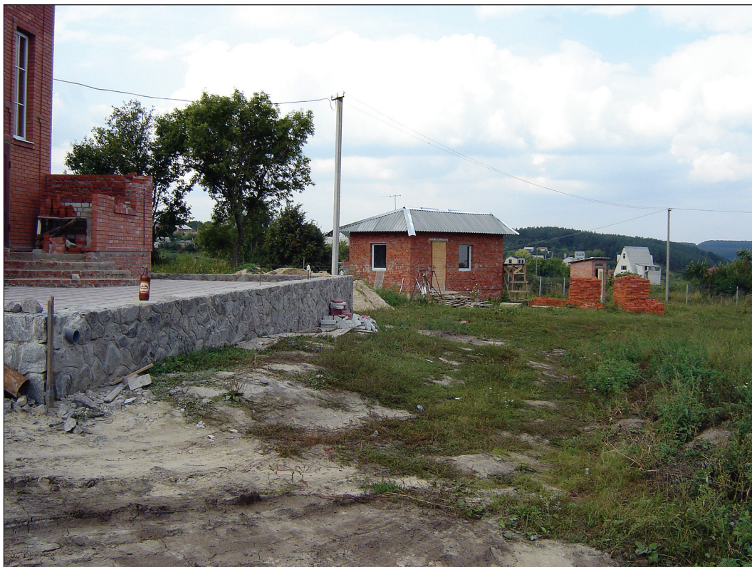
Рис. 3. Современные постройки на западной экспозиции цитадели Верхнесалтовского городища (2006 г., вид с юго-востока)