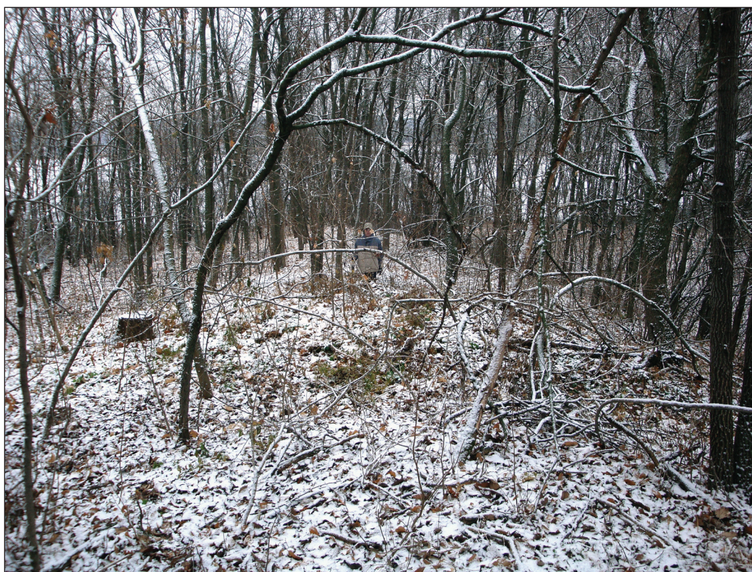
Рис. 2. Разрез вала С.А. Семенова-Зусера 1948 г. на южной экспозиции Верхнесалтовского городища (современное состояние, 2011 г., вид с запада)

Не менее печальна участь памятника и на остальных площадях городища. В первую очередь, это касается северного сектора памятника, где частной застройкой либо стали недоступными для научного исследования, либо уничтожены застройкой обширные площади внутренних дворищ и линий обороны. К примеру, еще относительно недавний раскоп 2002—2004 гг. [12, с. 10—17] на