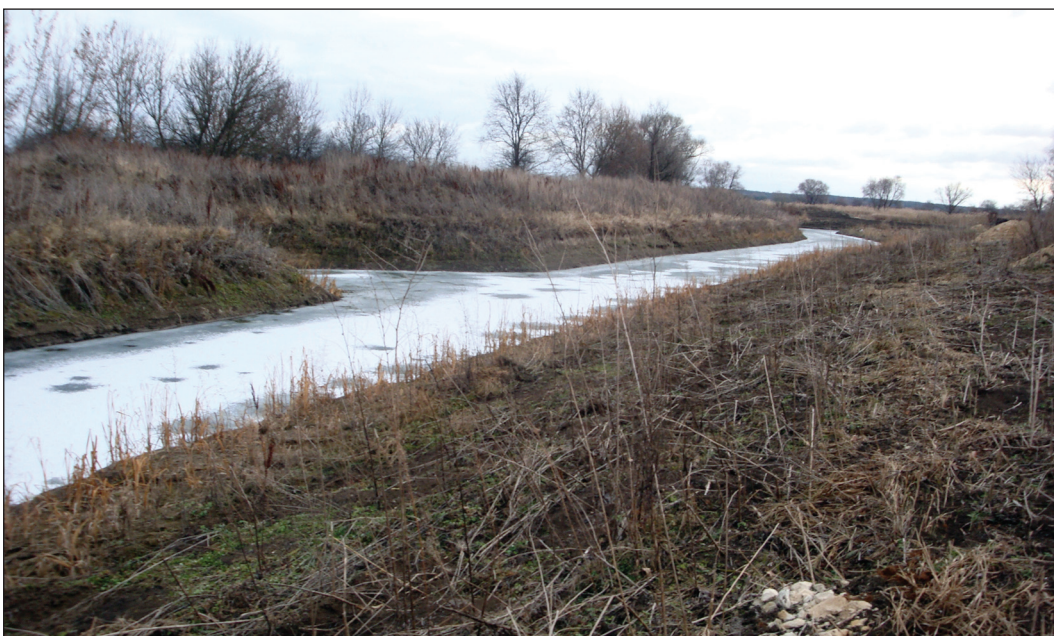
Рис. 10. Искусственный канал на Верхнесалтовском селище (2011 г., вид с северо-запада)