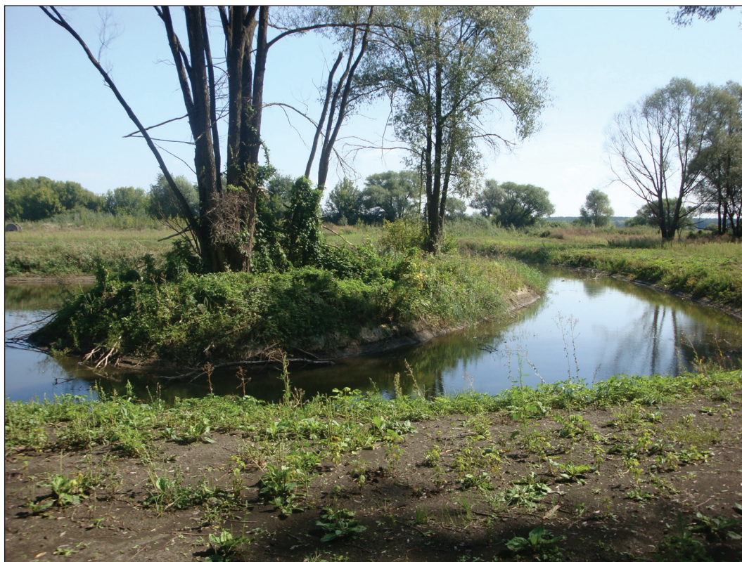
Рис. 11. Искусственный водоем с полуостровом на Верхнесалтовском селище (2012 г., вид с запада)