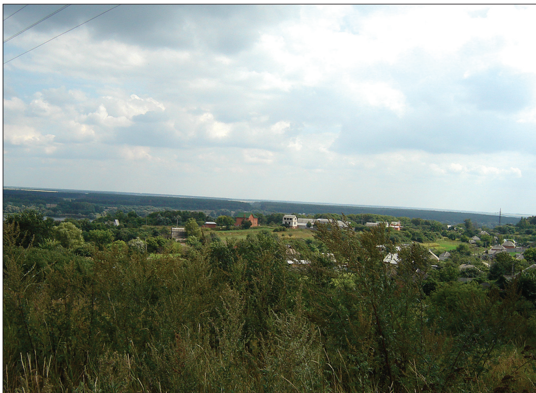
Рис. 5. Верхнесалтовское городище в начале XXI в. (вид с запада) Рис. 5. Верхньосалтівське городище на початку XXI ст. (вид із заходу) Fig. 5. Verhnij Saltiv settlement in the beginning XXI century (view from the west)