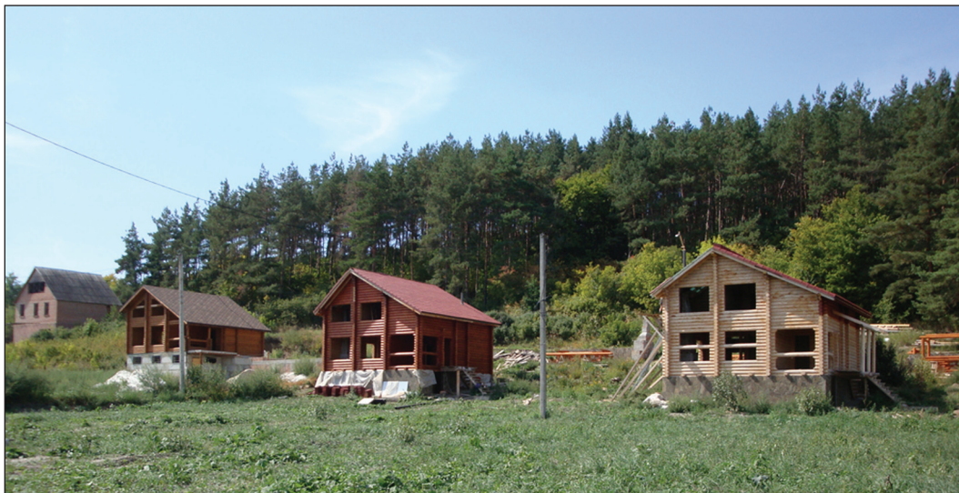
Рис. 7. Территория Верхнесалтовского селища у катакомбного могильника (на заднем плане на возвышенности, поросшей сосновыми деревьями; 2009 г., вид с востока — северо-востока)