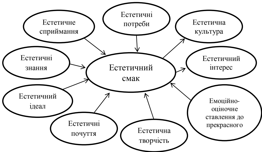
Рис. 1. Сутнісні ознаки естетичного смаку

Аналіз психолого-педагогічних джерел свідчить про те, що художньо-естетичний смак існує у безлічі специфічних різновидів. Тому, аналізуючи смак як одну з основних категорій естетики, варто дослідити й інші, допоміжні категорії, які сприяють кращому розумінню функцій та умов формування або функціонування смаків.