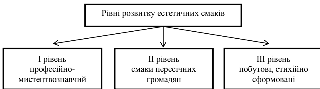
Рис. 4. Рівні естетичних смаків.

Що ж стосується рівнів естетичних смаків, то сучасні науковці виділяють наступні три рівні, що відображені на рис. 4.