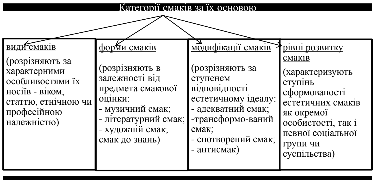
Рис.2 Категорії смаків за їх основою

Розглядають наступні категорії смаків за їх основою (рис. 2)